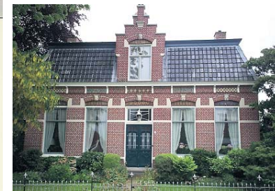
▲ Schoolmeesterswoning in Warffum, 1903.