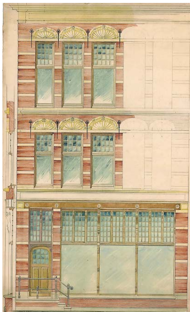
▲ Aquarel van het inmiddels verdwenen pand aan de Grote Markt NZ in Groningen.