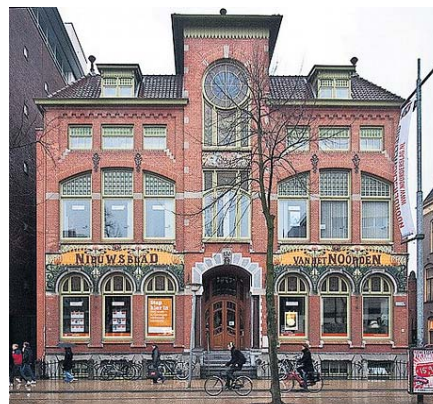
▲ Het pand van het Nieuwsblad van het Noorden in Groningen, 1903.