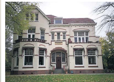
▲ Villa in Usquert, 1909.