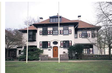
▲ Villa in Glimmen, 1913.